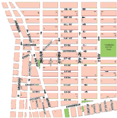
Grid van mahattan

Zo beschrijft Koolhaas in Delirious New York het belangrijke ‘commissioners plan’ uit 1811 dat over het ongerepte landschap van Manhattan een stedenbouwkundige gridverdeling plaatste. Het grid had een belangrijke eigenschap: het zorgde voor een balans tussen controle en niet controle. Een vaste afmeting van een perceel in het grid, kon vrij de hoogte in met een vorm die verschillende betekenissen krijgen. Het grid maakte de stad zowel geordend als chaotisch.